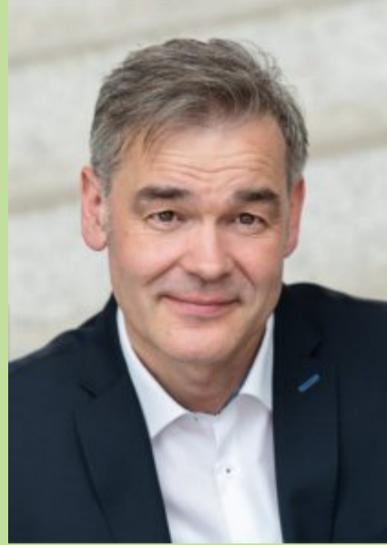
Peter Berek Landrat Wunsiedel im Fichtelgebirge

„Unser schönes Fichtelgebirge ist Heimat und Urlaubsziel zugleich. Die herrliche Landschaft und das abwechslungsreiche Freizeitangebot sorgen für eine hohe Lebensqualität für Jung und Alt. Mit seinen Initiativen, seinen Häusern und Wanderwegen leistet auch der Fichtelgebirgsverein einen großen Anteil dazu. Dafür danke ich den zahlreichen Ehrenamtlichen des FGV herzlich. Mit Projekten wie dem neuen, modernen Kornberghaus als Ausflugsziel und insbesondere dem Ausbau unseres Radwegenetzes wollen auch wir als Landkreis mit dazu beitragen, dass unsere Heimat liebens- und lebenswert ist.“