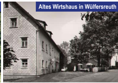
Altes Wirtshaus in Wülfersreuth