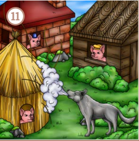
Die drei kleinen Schweinchen