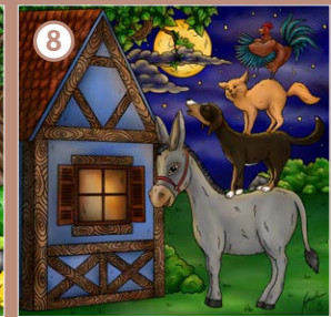
Die Bremer Stadtmusikanten