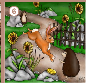
Hase & Igel