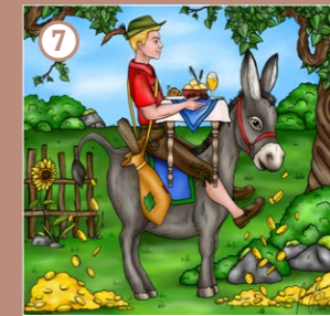
Tischlein deck dich