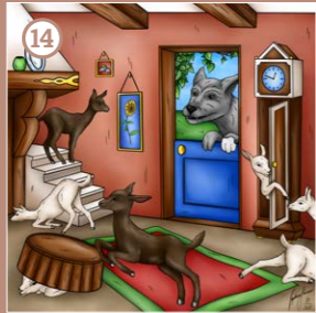
Der Wolf und die sieben Geißlein