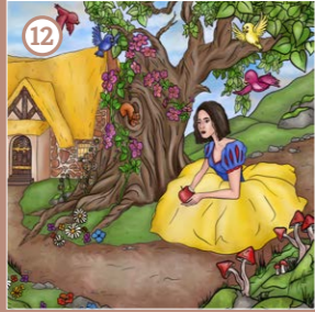
Schneewittchen & die sieben Zwerge